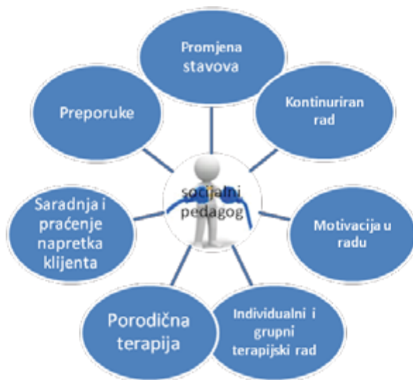
Grafikon 1. Uloga i značaj socijalnog pedagoga u radu s ovisnicima

Iz prethodnog primjera možemo zaključiti da bivši ovisnici imaju problema nakon završenog sociopedagoškog tretmana, u smislu neizvjesnosti da li će biti prihvaćeni i da li će se uspjeti uključiti u normalne životne tokove. Stoga, veoma je bitna saradnja socijalnog pedagoga sa drugim kolegama i strukama, kao i sa drugim relevantnim institucijama. Nezaobilazno je da u adekvatnim uslovima, kada se istinski i kvalitetno pristupa organizaciji tretmana, nužno je pratiti napredak klijenta i poslije procesa izlječenja kada se uključi u društvene tokove života, gdje ponovo značajnu ulogu ima socijalni pedagog.