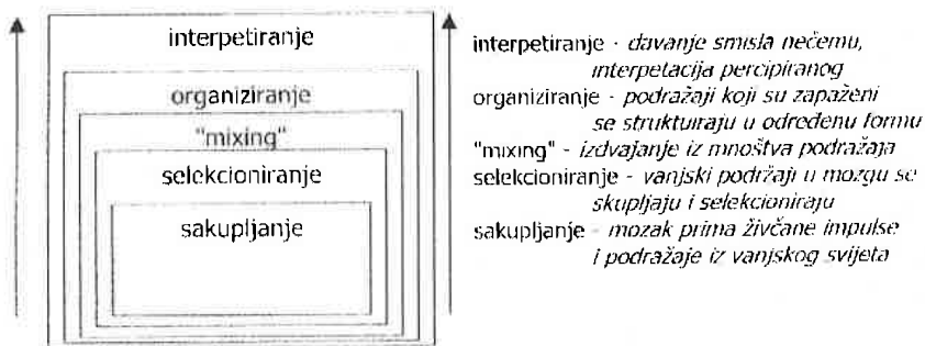
shema 1. prikaz stupnjeva procesa percipiranja

Opažanje vanjskog svijeta nije jednostavan proces, te on uključuje pet stupnjeva percipiranja 3 :