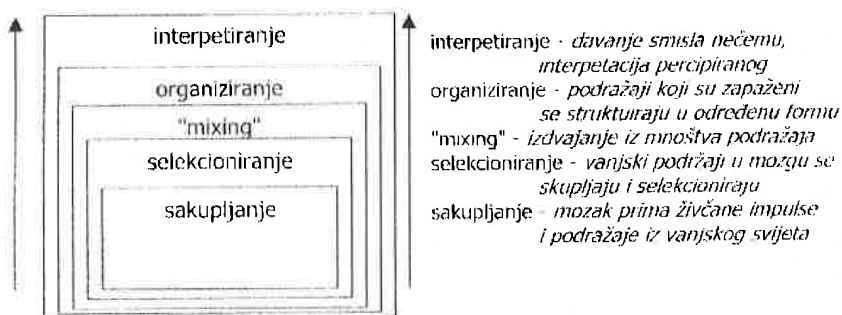
shema 1. prikaz stupnjeva procesa percipiranja

Opažanje vanjskog svijeta nije jednostavan proces, te on uključuje pet stupnjeva percipiranja 3 :