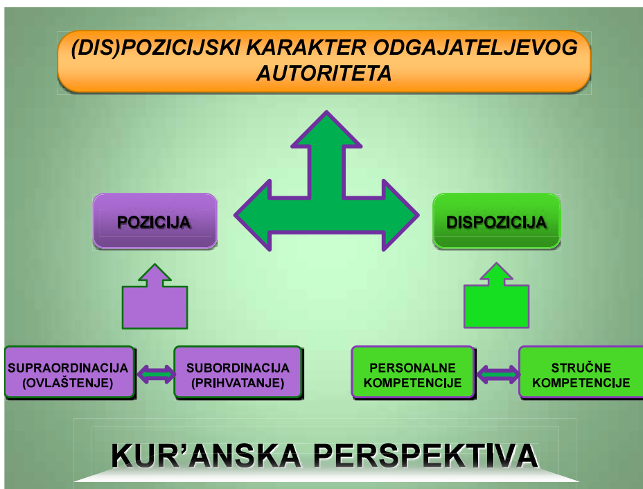
Slika 1. Odgojni autoritet

Pod sintagmom kompetencijski autoritet podrazumijevamo osobu koja je u prevladavajućoj mjeri osigurala/zaslužila 2 položaj autoriteta na osnovu vlastitih sposobnosti. Nasuprot tome stoji pozicijski tip autoriteta, čija snaga primarno izvire iz funkcije na koju je postavljen. Iz ajeta koji se tiču odgojnog autoriteta saznajemo da Kur'an časni objedinjuje oba navedena tipa. Uzvišeni Allah garantira uspjeh vjernicima koji bespogovorno prihvate poslanički autoritet: Kad se vjernici Allahu i Poslaniku Njegovu pozovu da im on presudi, samo reknu: 'Slušamo i pokoravamo se!' – Oni će uspjeti. (Kur'an, pr. Korkut, 24:51) Ovaj i niz drugih ajeta (npr. Kur'an, 3:31, 24:63 i 33:36) ojačava formalno-pozicijsku stranu odgojnog autoriteta. Uporedo s tim, Uzvišeni Allah, opisujući poslanike, prezentira spektar personalnih kompetencija koje osiguravaju dispozicijsku stranu njihovog odgojnog autoriteta. Ako odgajatelj u svom radu svjedoči takav spoj, za njega se tada može reći da je dosegao (dis)pozicijski autoritet usklađen s kur'anskim zahtjevima. Analizirajući kur'anske ajete koji govore o dispozicijskoj strani