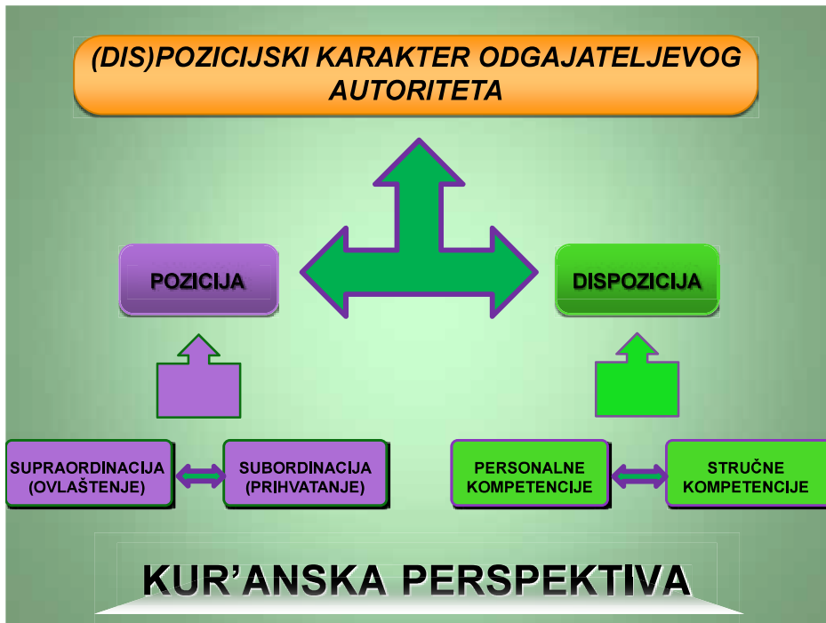
Slika 1. Odgojni autoritet

Pod sintagmom kompetencijski autoritet podrazumijevamo osobu koja je u prevladavajućoj mjeri osigurala/zaslužila 2 položaj autoriteta na osnovu vlastitih sposobnosti. Nasuprot tome stoji pozicijski tip autoriteta, čija snaga primarno izvire iz funkcije na koju je postavljen. Iz ajeta koji se tiču odgojnog autoriteta saznajemo da Kur'an časni objedinjuje oba navedena tipa. Uzvišeni Allah garantira uspjeh vjernicima koji bespogovorno prihvate poslanički autoritet: Kad se vjernici Allahu i Poslaniku Njegovu pozovu da im on presudi, samo reknu: 'Slušamo i pokoravamo se!' – Oni će uspjeti. (Kur'an, pr. Korkut, 24:51) Ovaj i niz drugih ajeta (npr. Kur'an, 3:31, 24:63 i 33:36) ojačava formalno-pozicijsku stranu odgojnog autoriteta. Uporedo s tim, Uzvišeni Allah, opisujući poslanike, prezentira spektar personalnih kompetencija koje osiguravaju dispozicijsku stranu njihovog odgojnog autoriteta. Ako odgajatelj u svom radu svjedoči takav spoj, za njega se tada može reći da je dosegao (dis)pozicijski autoritet usklađen s kur'anskim zahtjevima. Analizirajući kur'anske ajete koji govore o dispozicijskoj strani